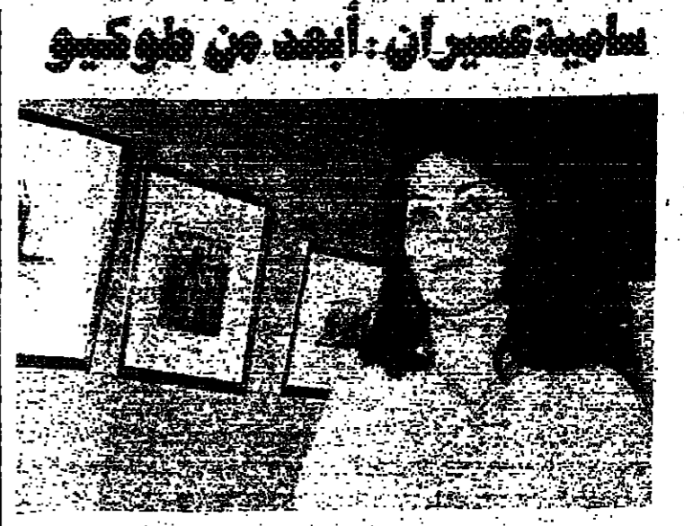
سلبية عسيران: أبعاد من طوكيو